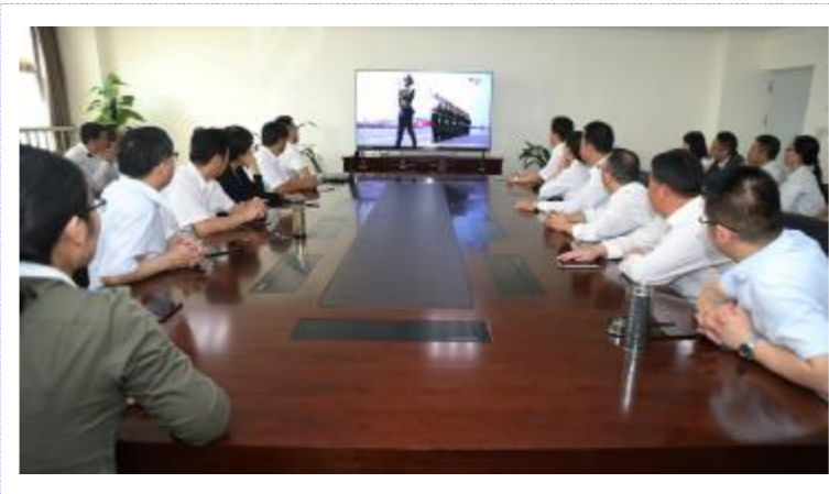
(宣传科 周培荣 叶思思)

10月1日上午,我院党政领导班子成员和部分职能部门负责人集中收看庆祝中华人民共和国成立70周年大会实况转播,通过聆听习近平总书记的讲话,观看大阅兵和群众游行,大家盛赞祖国70年的发展成就,表示要坚定信心,立足岗位,为“健康盱眙”建设多做贡献。